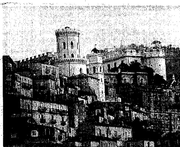
Una veduta di Corigliano