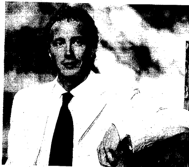
Il giornalista e scrittore Marco Travaglio