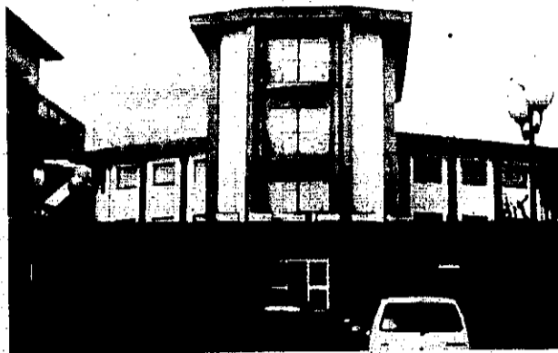
Il Comune di Diamante

tore e responsabile del procedimento. La redazione del Psc avrebbe dovuto coinvolgere altri professionisti, da reperire ed utilizzare attraverso il conferimento di incarichi