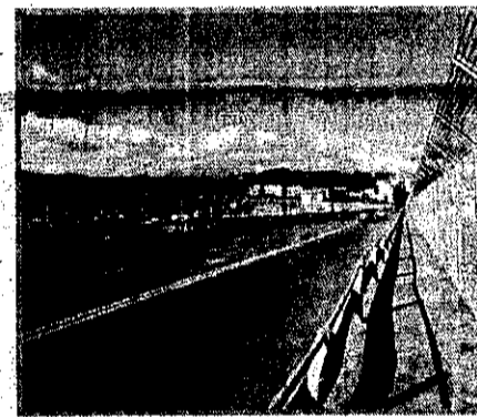
INVALIDABILI Le barriere d'acciaio installate sul ponte Mancini

È in via di ultimazione la messa in sicurezza del ponte Mancini, intervento dal Comune di Cosenza nell'ambito del più ampio progetto sicurezza che ha riguardato anche interventi urgenti su arterie cittadine, alcune interessate da movimenti franosi. Sulle fiancate del ponte sono state poste barriere in pannelli grigliati d'acciaio di 2,60 metri d'altezza (identici a quelle che delimitano l'antistadio del San Vito). Negli anni passati il ponte Mancini era stato teatro di numerosi tentativi di suicidio. Il Comune fa sapere che a breve riprenderanno i lavori per la rotatoria su viale della Repubblica (all'angolo con l'ospedale dell'Annunziata). Sarà costruito anche un nuovo marciapiede sul lato destro di via Migliori.