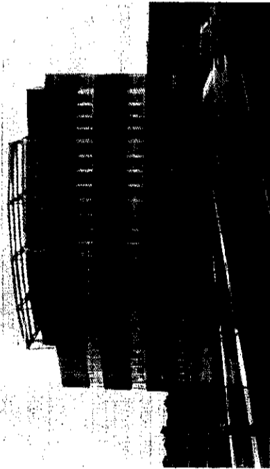
La sede dell'Autorità portuale a Gioia Tauro