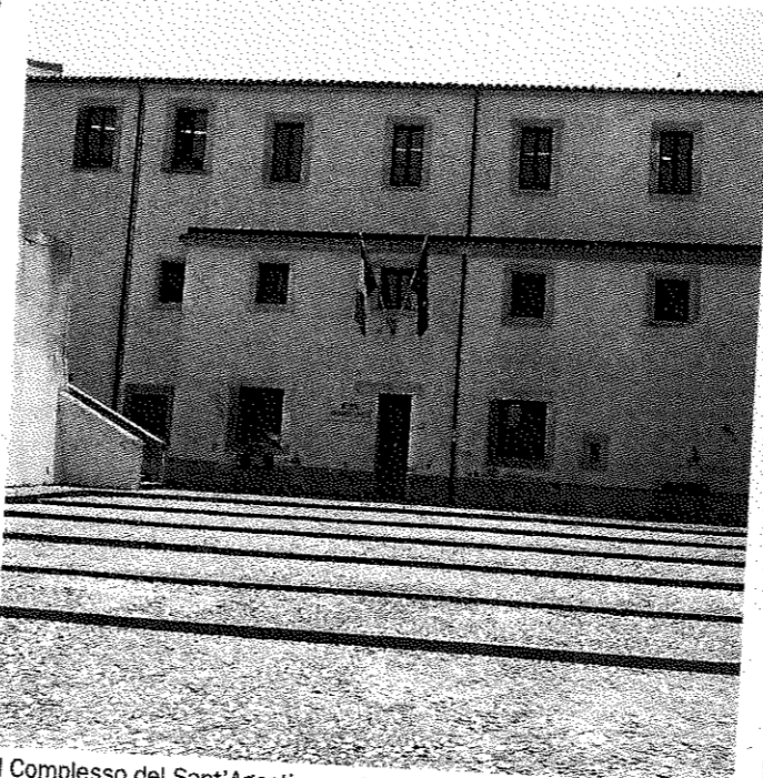
Il Complesso del Sant'Agostino sede dell'amministrazione comunale