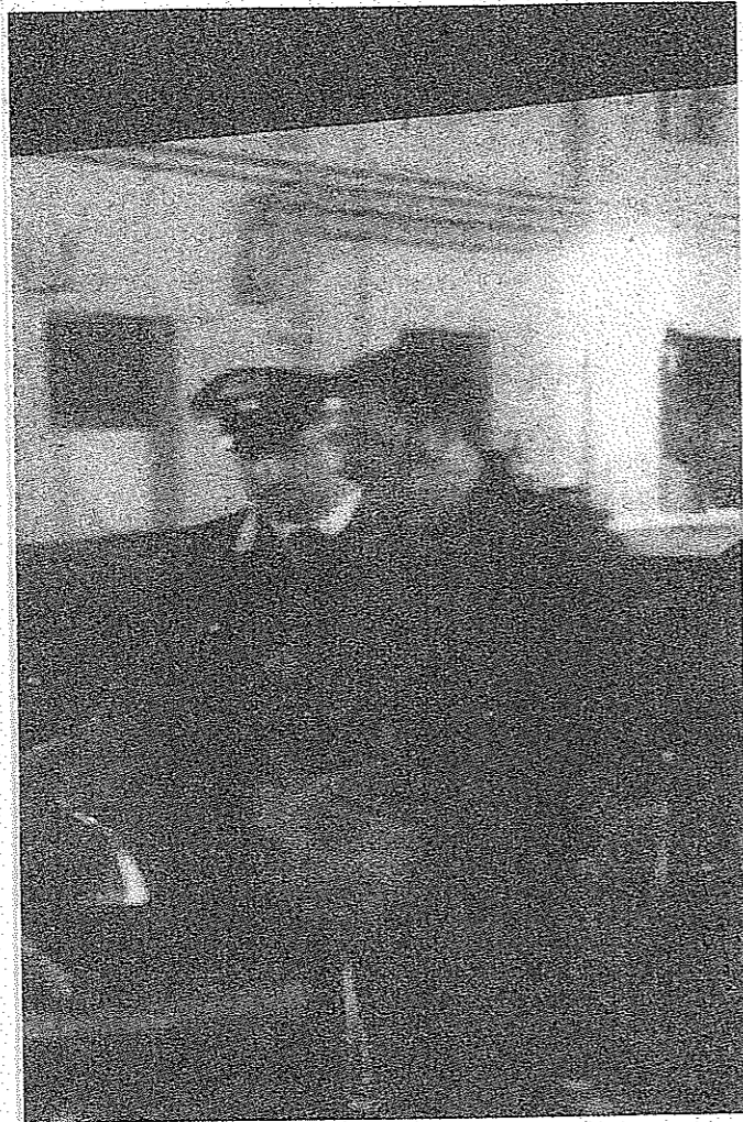
Il presunto boss Santo Crucitti il giorno dell'arresto eseguito dai carabinieri