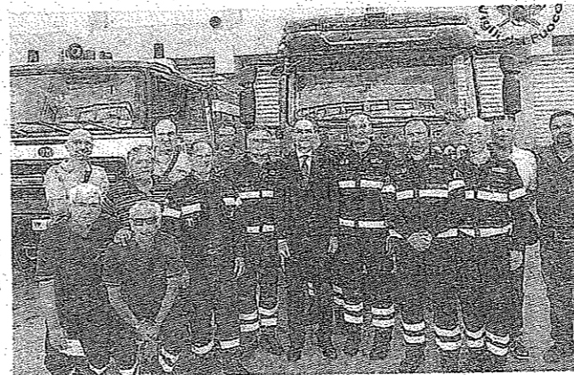
Il prefetto Vincenzo Panico nel corso della visita alla caserma dei vigili del fuoco

L'incontro istituzionale, ma a conferma di un rapporto di sinergia tra l'ente Comune e il corpo dei vigili del fuoco, si è tenuto nella giornata di mercoledì. Il prefetto Vincenzo Panico si è trattenuto a lungo nella caserma di via Sbarre Superiori, vistando la struttura ed incontrando il comandante provinciale, ingegnere Emanuele Franculli, e gli uomini che erano impegnati nell'attività lavorativa. In una nota diffusa dall'ufficio comunicazione del Comando dei vigili, si rimarca come «l'occasione sia stata particolarmente gradita dai vigili del fuoco e dai rappresentanti delle organizzazioni sindacali di categoria con