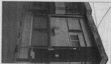
Il Comune di Roggiano Gravina

Tutto secondo legge, la procedura seguita dal Comune di Roggiano per l'affidamento dei lavori in località Lardereria è legittima. È quanto stabilito dal Consiglio di Stato che ha accolto integralmente le tesi dell'avvocato Oreste Morcavallo, nell'interesse dell'Ente, e ha definitivamente respinto l'istanza cautelare proposta dalla ditta Impresa edile Stella Francesco. È stato capovolto, dunque, il ricorso presentato dalla ditta davanti al Tar. I fatti risalgono al 31 ottobre 2012. Il Comune di Roggiano Gravina ottiene un finanziamento per i lavori di recupero delle strutture esistenti presso il sito archeologico di Lardereria. Visto i tempi di esecuzioni stringenti (entro 180 giorni) per non perdere i soldi si è ricorso all'affidamento dei lavori attraverso la procedura per lavori in economia con il cofinno fiduciario e stabiliva che gli operatori economici da consultare erano individuati dall'elenco predisposto dalla stessa giunta municipale con il sistema della rotazione escludendo le ditte che avevano lavori in corso. Da qui l'impres, che non si è aggiudicata i lavori, avrebbe ravvisato delle presunte irregolarità che, invece, non si non verifiche secondo il Consiglio di Stato.